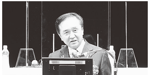
黒岩神奈川県知事