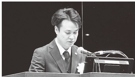
大会宣言を行う神奈川県中小企業青年中央会の碓谷会長