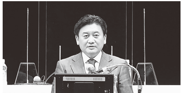
武部農林水産副大臣