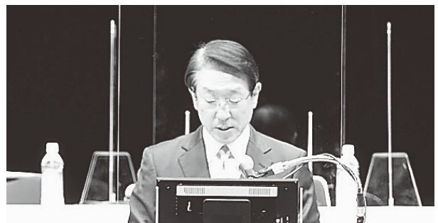
関根商工中金代表取締役社長