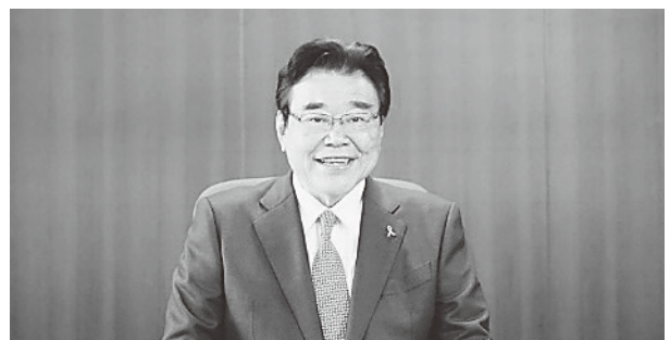
後藤厚生労働大臣