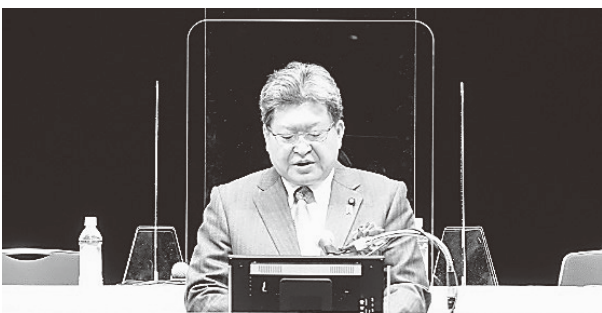
萩生田経済産業大臣

萩生田光一経済産業大臣、武部新農林水産副大臣、黒岩祐治神奈川県知事、山中竹春横浜市長、関根正裕株式会社