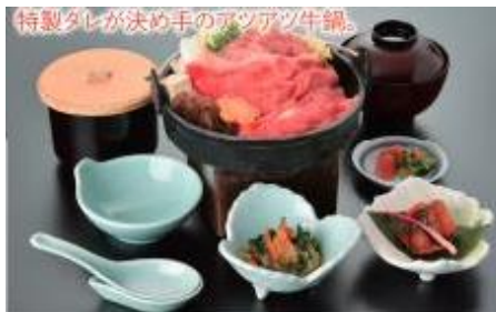
10月10日昼食 上杉城史苑 米沢牛鍋