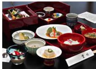
10月12日昼食 雲外 伊達精進懐石料理