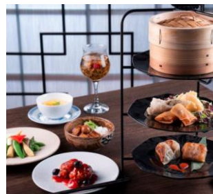
10月11日昼食 桂花苑 中華ランチコース